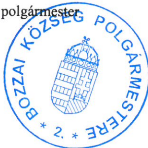
Héra-Csizmadia Fanni polgármester