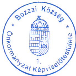
Héra-Csizmadia Fanni polgármester