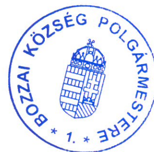
Héra-Csizmadia Fanni polgármester