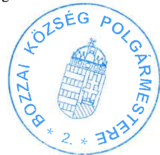
Héra-Csizmadia Fanni polgármester